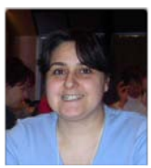
par Genevieve Chemouil, commis-comptable

(Réf : l'Activité-Projet - Daniele Pelletier-Edi. Modulo 2001)